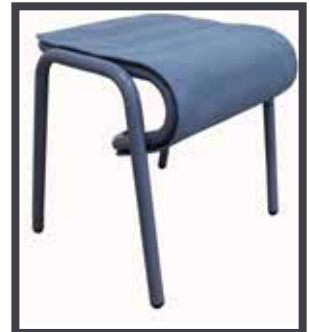
REPOSE PIEDS & TABOURET